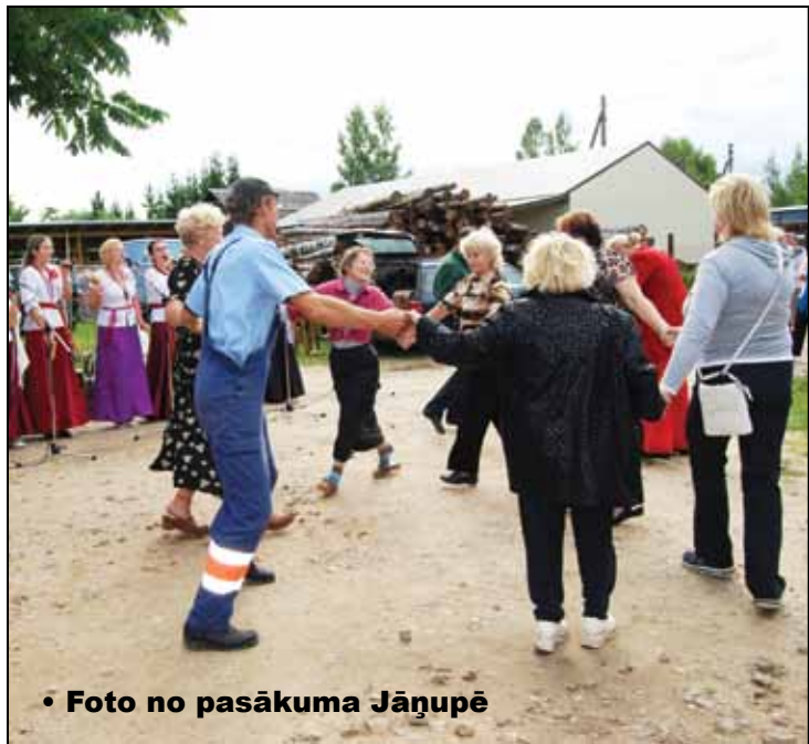
• Foto no pasākuma Jāņupē